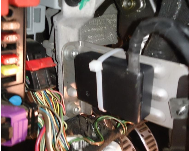
Figura - 3