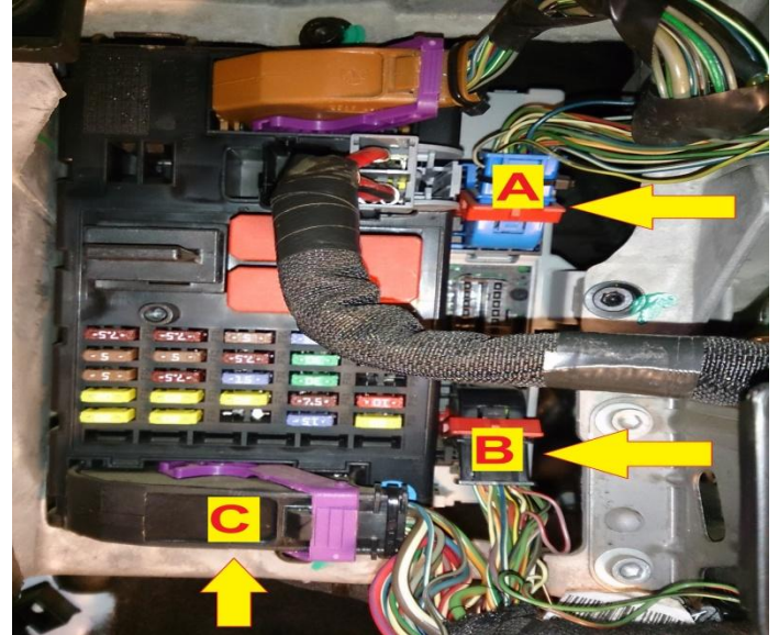
Figura - 4