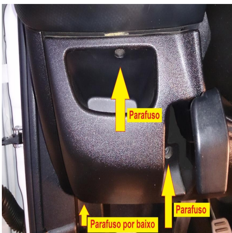
Figura - 1