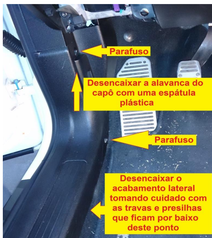
Figura - 2