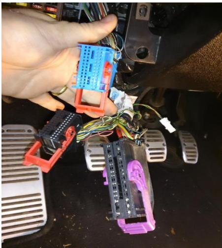
Figura - 5

As cores dos conectores podem variar de um carro para outro. Siga as fotos sem se preocupar com as cores.